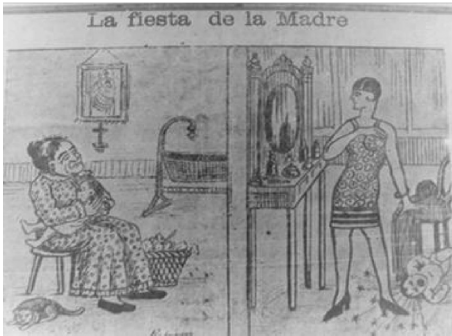
3. Rodríguez, “La fiesta de la madre”, El Bateo Ilustrado , (925) Medellín, 9 de mayo de 1928, p. 7.

La mujer vista tradicionalmente como “la reina del hogar”, que en su calidad de madre era una “santa” y esposa “abnegada”, no encajaba con la mujer que se dedicaba al comercio, al trabajo de oficina y fábrica y asistía por su cuenta a eventos públicos. Descuidaba el hogar, según la visión de El Bateo y demás sectores tradicionalistas. La caricatura “La fiesta de la madre” hacía un paralelo entre las “madres de ayer” y “las de hoy”. La primera, poco aliñada, estaba cargando a su hijo, brindándole especial cuidado, la segunda, en cambio, se preparaba frente al espejo para salir a algún evento, mientras su hijo estaba en el suelo, golpeado y llorando; ella, sin embargo, continúa indiferente: