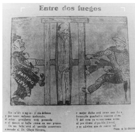
2. Wolpear, “Entre dos fuegos”, El Bateo , Medellín, 16 de mayo de 1931, p. 1.

respecto a su programa de “concentración nacional”, que divagaba entre los intereses de ambos partidos. Mientras el conservador es personificado por un sacerdote, el Partido Liberal está representado por el “pueblo liberal”. Estas personificaciones no eran gratuitas. Según Gombrich, la combinación de personificaciones ya instauradas en la mente del público es para el caricaturista una de sus principales herramientas 45 . el Partido Conservador representado por la Iglesia Católica, la que a su vez está personificada por la imagen de un sacerdote; el Partido Liberal representado por la imagen del pueblo, una imagen folclórica que coincidía con la idea que la élite tenía de él.