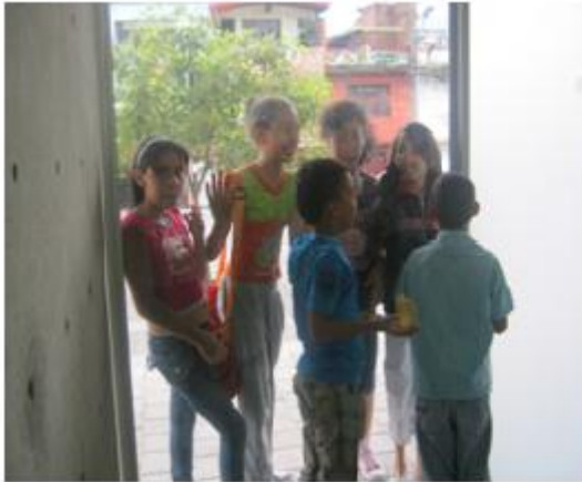
"Adentro es afuera", las chicas están afuera, los chicos adentro pero parecen todos dentro, Ventana del restaurante. Institución educativa "La Caja de cristal" 2010.