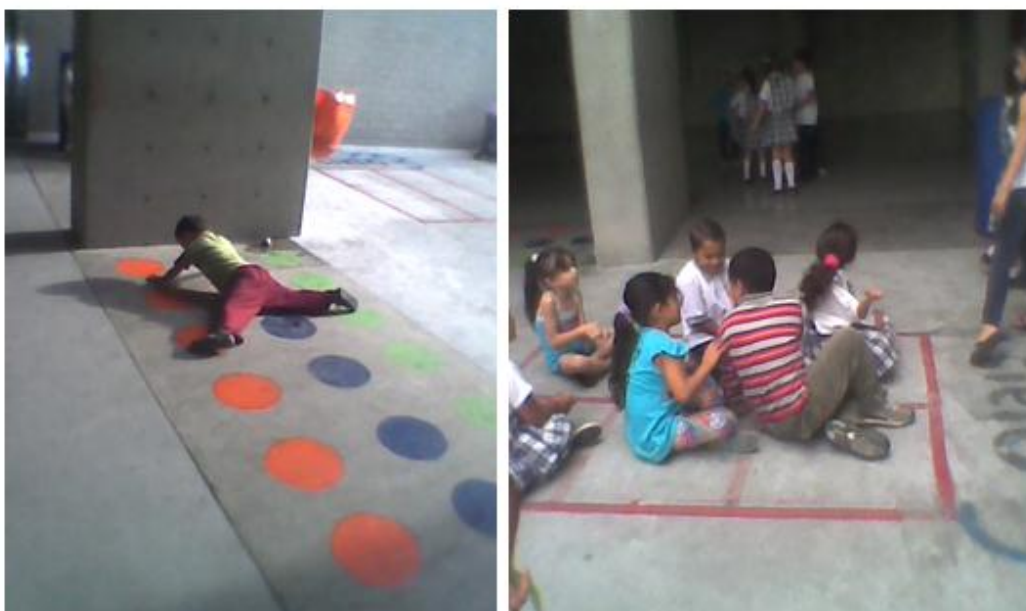
Juegos de piso pintados por docentes Institución educativa "La caja de Cristal" 2010

Pero solo logramos pintar unos pocos juegos, (cada vez que programábamos esta actividad ocurría algún imprevisto, como otras reuniones, incapacidad por enfermedad de varios maestros al mismo tiempo, las lluvias frecuentes). Aún así, logramos observar los buenos resultados que estos podrían hacer en los niños y niñas, esperamos que al comienzo del año 2011, podamos terminar implementar esta estrategia, aunque consientes que esta no debería ser la solución definitiva a este serio inconveniente que dejó al descubierto una visión muy corta sobre las necesidades de los niños y las niñas, y la incapacidad para vincular disciplinas del conocimiento que alimenten proyectos de manera conjunta, esta limitación con el espacio es mucho más seria de lo que se ve a simple vista, ¿Cómo se pretende brindar un espacio diferente y digno para niños y niñas si no se priorizan sus necesidades?, ¿Cómo lograr poner al servicio de ellos una pedagogía innovadora, creativa y acorde a sus necesidades si nos debemos gritar para escucharnos, y el