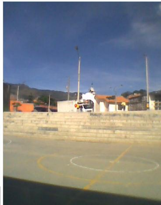
La cancha y los carros Institución educativa "La Caja de Cristal" 2010

Frente a esta situación, al interrogar por que el colegio fue construido en esta posición y con tan escaso espacio para el juego Montoya explicó que en el diseño inicial además de la gran antesala existía también una gran zona de juegos, pero por falta de presupuesto se debió recortar el diseño y el espacio para la construcción se redujo, pues el estudio de suelos demostró que debía haber un retiro de 10 metros con las casas construidas en los alrededores, y el edificio debe estar a una distancia de 50 metros con respecto al cementerio pues está catalogado patrimonio arquitectónico de la ciudad, quedando menos espacio para la construcción (Montoya, 2010).