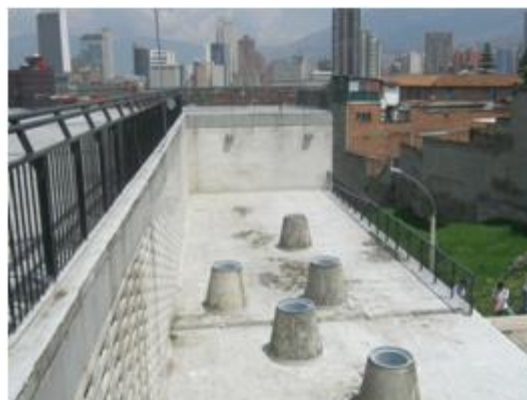
Muro que permite el acceso a la terraza desde la cancha. Institución educativa “La Caja de cristal” 2010.

La norma también recomienda prever dentro de los predios destinados para las instituciones educativas, áreas de aislamiento para favorecer iluminación, vías de acceso, campos deportivos, la conservación de la vegetación y formas de vida