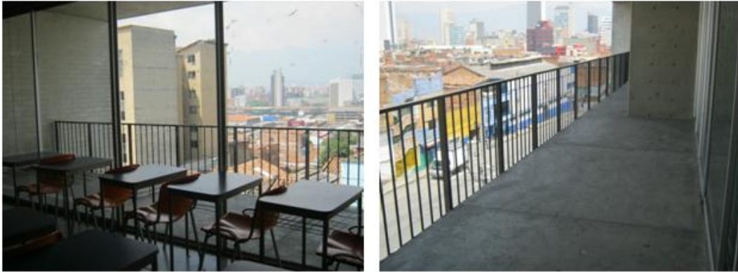
Balcones de las aulas del costado occidental institución educativa "La Caja de cristal" 2010

Yo personalmente les tengo prohibido salir al balcón, esa es una norma muy clara en mi grupo, ese espacio es muy inseguro, solo una vez los dejé salir a realizar un trabajo en equipo, era una lectura y un dibujo pero con la condición de no pararse nadie del puesto que les asigné, porque me muero del susto cuando están allí.