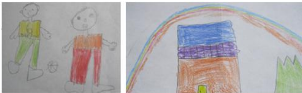
"Qué bueno jugar en la terraza y en chancha con el balón y en esta manguita del lado" Ángel, 7 años