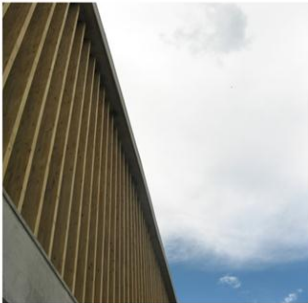
Colegio en Santo Domingo Savio 2009

Con respecto al control de la luz y la radiación solar, las instituciones escolares según la norma en cuestión, deben orientarse perpendicular a un eje norte – sur, además construir aleros o pensar en otras soluciones que permitan controlar a voluntad el paso directo de los rayos solares, un buen ejemplo de este tipo de precaución contra la luz solar se observa en otro de los colegios pensados bajo la filosofía de escuela abierta, Antonio Derka, en el Barrio Santo Domingo Savio.