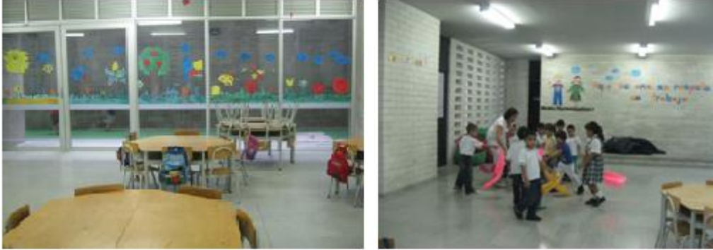
Aula de preescolar Institución educativa "La Caja de Cristal" 2009

Sobre este asunto Montoya (2010) aclara que no es un espacio residual y que se proyectó desde los inicios del diseño de esta forma, con un patio interno, un poco más grande con árboles y otras plantas sembradas, pero esto no fue posible pues en este espacio están ubicados unos tanques de agua que no permiten el peso de plantas sembradas allí, sin embargo el espacio se acondicionó de manera agradable y funcional; además el tamaño del aula es muy generoso garantizando espacios seguros, que permiten libertad de movimiento, y favorecen la expresión corporal, explica Montoya que esto se debe a una norma específica para el espacio en preescolar, debe ser del doble de un aula normal.