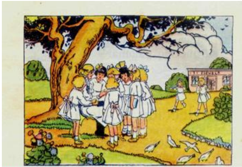
imagen del libro "alegría de leer", pag 7.

El deseo del saber “debería” ser tan grande y deberían estar tan motivados con las actividades escolares que ellos y ellas solitos deberían permanecer al lado de sus maestros y maestras, pero ¿nuestra ciudad con sus condiciones sociales permiten algo así? ¿Puede ser en realidad nuestra escuela así? ¿Por qué no siempre lo es? ¿Somos los maestros y maestras tan atractivos para nuestros alumnos y alumnas? ¿Está nuestro sistema escolar preparado para enfrentar las necesidades actuales? ¿Y más en las comunas donde existen tantas dificultades académicas y disciplinarias se presentan? Donde la ley muchas veces es manejada por grupos al margen de ella y las cuestiones de seguridad se tornan tan difíciles, claro que habría que entender que esta imagen corresponde a un momento con características muy diferentes a las actuales, sería interesante soñarnos con algo así, que bonito fuera sentarnos bajo el árbol a leer un cuento, a mirar la hierba o a sentir el viento y describirlo, pero como hacerlo con 35 estudiantes con ganas de volar, solo por el placer de desafiar la autoridad del maestro... es todo un reto