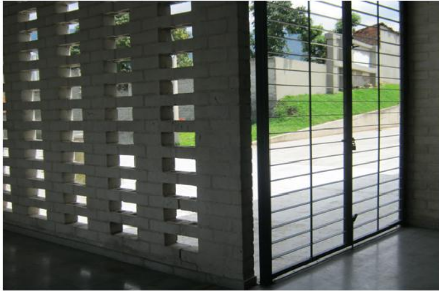
Muro que da la cancha. Institución educativa "La Caja de cristal" 2010