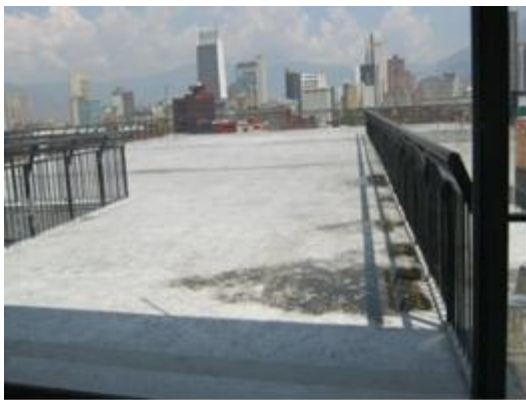
Terraza. Institución educativa “La Caja de cristal” 2010.

sobre puso un pedazo mas de baranda de 30 centímetros, siendo aun insuficiente, este espacio no es usado en el colegio, en un principio por determinación del coordinador y luego porque de alguna manera se instauró en el pensamiento de los profesores, profesoras y acudientes que era un espacio inseguro, de hecho algunos niños y niñas se suben en las barandas, hasta el medio cuerpo y se balancean en forma temeraria, en otros casos, otros niños han pasado al otro lado de la baranda, usando el muro para bajar por él y salir del colegio pues uno de los muros da a la cancha, o por el contrario personas ajenas suben por los muros a esta terraza. Al narrar esta situación al arquitecto comentó que esto no era previsible y que este mismo sistema de muros se han implementado en otras construcciones y aunque al principio causó un efecto parecido en los niños y niñas poco a poco se fue educando a la población y no ocurrió mas, es posible que esta situación sea un caso particular en la institución “La Caja de Cristal”, por sus características oposicionales en muchos de sus niños y niñas, aun así, se debe buscar una solución para usar este espacio.