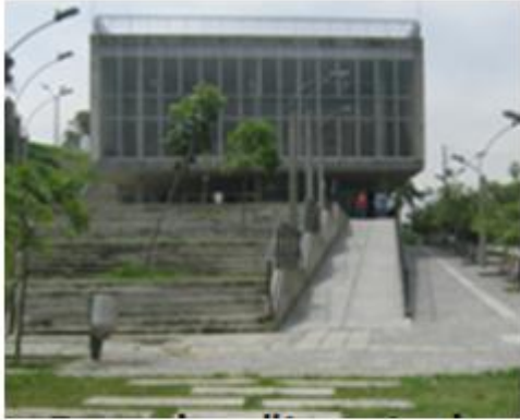
Entrada a la institución educativa "La Caja de cristal" 2010.

Cuando me encontré en este, un lugar mágico; un nuevo colegio, uno de calidad, recién hecho, agradable en su entrada, amplio, fresco, iluminado, ventilado, "muy bien ubicado", en todo el centro de la ciudad, cargada con un montón de experiencias en mi morral, que además no tenía ni idea que hacer con ellas. Sabía que, finalmente y como ya lo expresé, de algo me debían servir. Además, por eso había regresado de nuevo a la