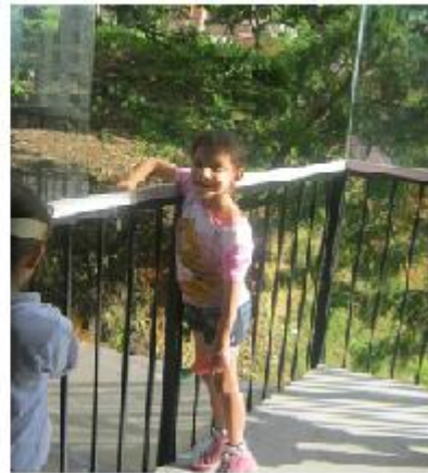
Y si se rompe "La Caja de cristal" ... como en este caso se rompió uno de los ventanales, eso significa que ya estamos afuera. Institución educativa "La Caja de cristal" 2010.

Al tomar posesión del espacio vivido éste se convierte en un elemento definitivo en la formación de la personalidad de cada ser, funcionando de esta misma manera