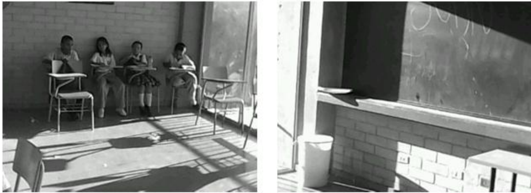
Ingreso en exceso de luz solar en horas de la tarde en aulas del costado occidental. Institución educativa "La Caja de cristal" 2010.

Según Montoya (2010), como ya se mencionó se realizó un estudio previo sobre la direccionalidad del sol, y está construido en forma perpendicular al eje norte sur, sin embargo en el transcurso del año esta direccionalidad solar cambia.