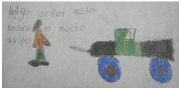
"Oiga señor está haciendo mucho ruido" Wilder 7 años.