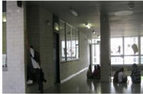
Aunque son los mismos espacios, se viven de manera diferente. Institución educativa "La Caja de cristal" 2010.

Sin embargo a pesar de lo heterogéneo, si queda claro que tanto para los alumnos más grandes, los aun adolescentes, como para los pequeños la sensación de encierro dentro de "La caja de cristal" persiste.