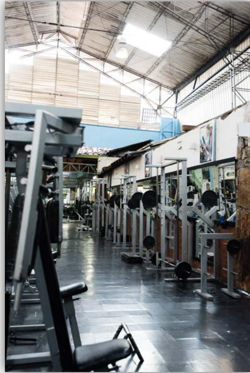
Imagen 20. Gimnasio Universal II.