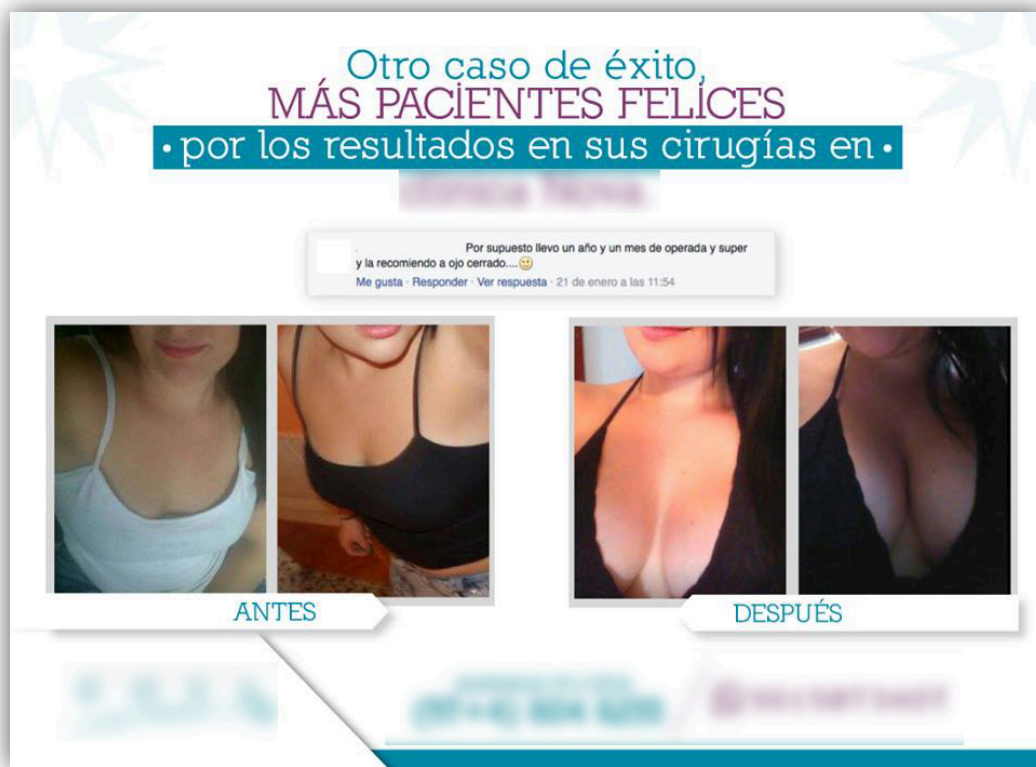
Imagen 21. “Más clientes felices”.

Todas las imágenes fueron tomadas de la página oficial del centro de cirugías estética, guardando la confidencialidad de la clínica y las personas que aparecen en las imágenes.