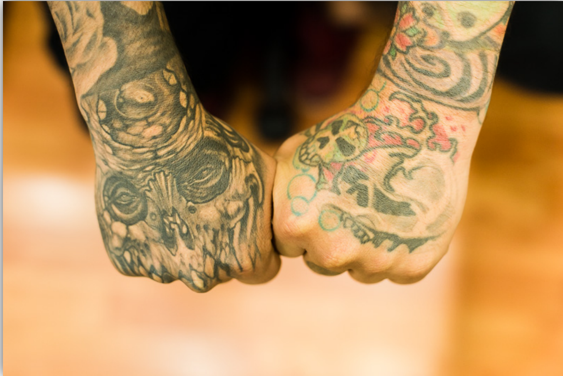
Imagen 6. Manos de Juan Esteban.