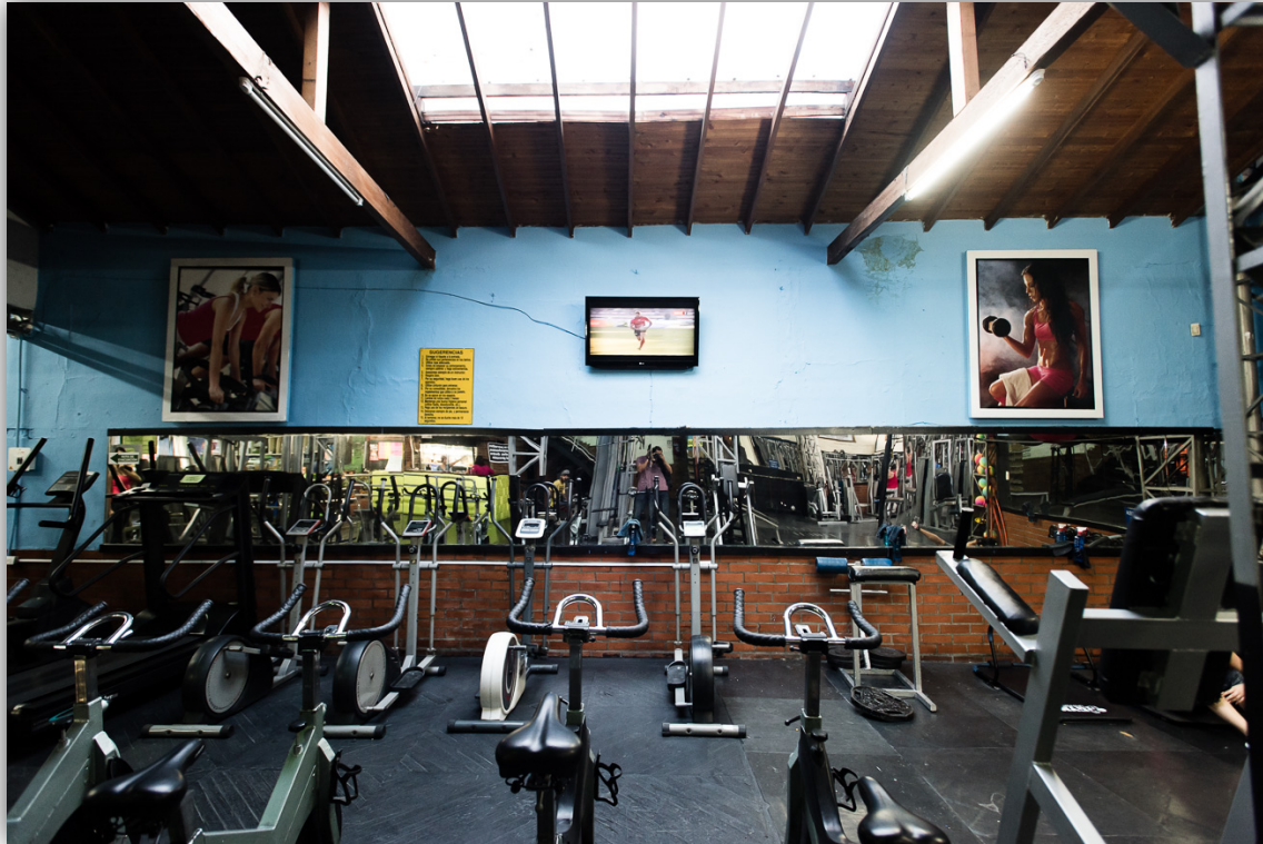
Imagen 19. Gimnasio Universal.