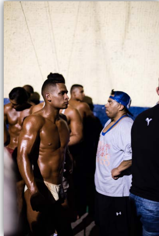
Imagen 23. Campeonato de culturismo en Guarne.