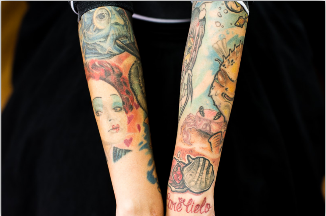
Imagen 2. Brazos de Cindy.

estudio. “Especialmente jóvenes, con menos de treinta, treinta y cinco máximo... muy pocos mayores de cuarenta y sólo hemos tenido dos mayores de cincuenta... Los jóvenes que vienen son de todo tipo... desde los chicos reggaetoneros hasta los que escuchan Rap... de todos... es que el tatuaje ya dejó de hacer parte de un solo tipo de persona, todos lo llevan...” . Los mayores de cincuenta, me dice, se tatuaron rostros, posiblemente de sus hijos, nunca se los preguntó.