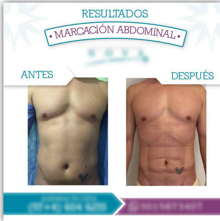
Imagen 15. Publicidad clínica de cirugías estéticas. Tomada de su página de internet.