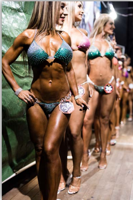
Imagen 14. Concursantes categoría Bikini.

Hay rituales, previos a la competición: depilación total, para que los músculos se puedan ver mejor, y el bronceado, para lo cual usan una pintura y un aerosol, que huele a menta. Todo el auditorio queda impregnado a esta sustancia. Los competidores y competidoras, posan frente a los jueces y al público, con sus figuras doradas. Se muestran por cinco minutos, aproximadamente, en la etapa grupal y dos más en la muestra individual.