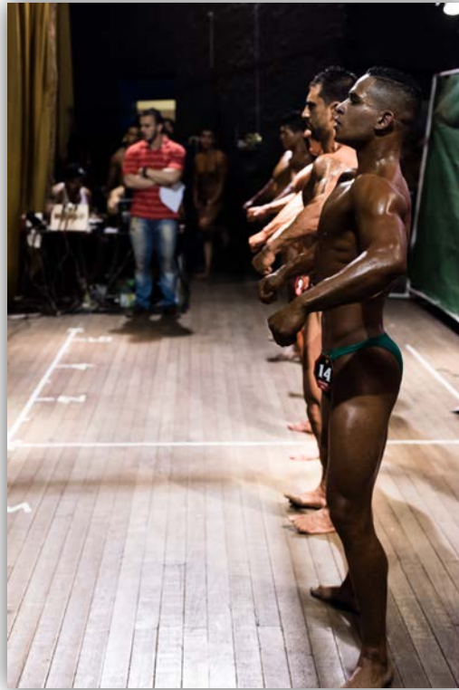
Imagen 13. Competidores Bodyfitness.

Son cerca de diez jueces y están sentados en una mesa frente a la plataforma. Dan indicaciones sobre la pose que deben adoptar, y me regañan un par de veces porque intefiero, por tomar las fotos, con sus evaluaciones. Los calificadores, me cuentan, podrían solicitar comparaciones específicas entre competidores, para comparar detalladamente ciertos grupos musculares.