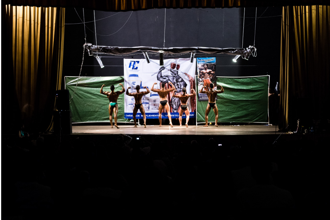
Imagen 24. Campeonato de culturismo en Guarne II.