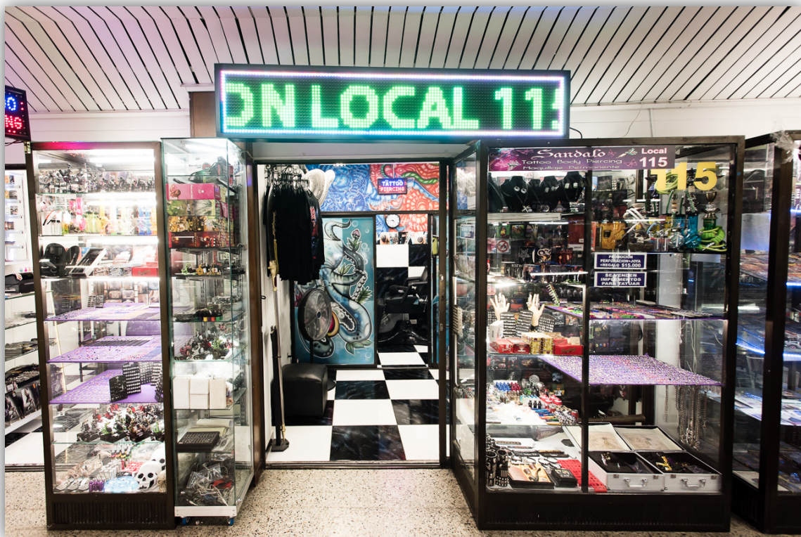
Imagen 17. Estudio de tatuado en el Centro de la Ciudad.